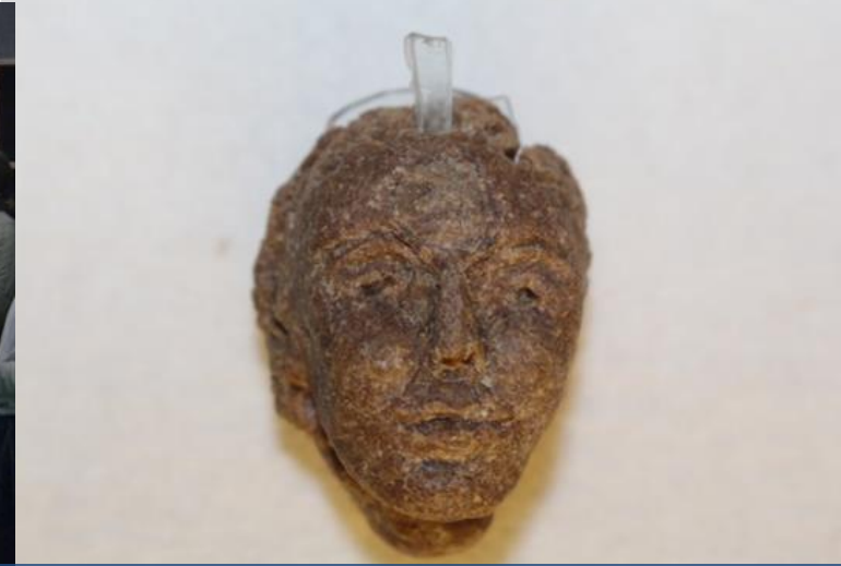
פסל לחם, אינגה דרבינגר, עשוי מקצבת המזון היומית Wachturm-Gesellschaft, Geschichtsarchiv Selters/Ts, 2017 (מושאל מאוסף אתר הזיכרון "השור האדום" האלה)

מתוך כך התברר הצורך בהתאמת הקונספט של אתר הזיכרון תוך התייחסות לשאלות הקשורות בשימוש בחדרי המרכזיים הן בתקופת הדיקטטורה הנציונל-סוציאליסטית והן על ידי השטאזי.