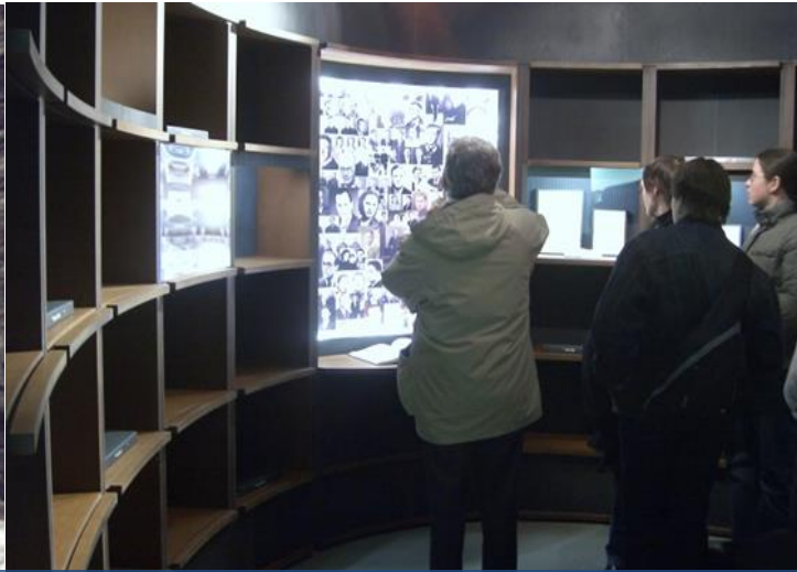
חדר "גורלות יחידים" בתערוכת הקבע בנושא המשטר הנאצי, 2006 (אייקון הנובר)