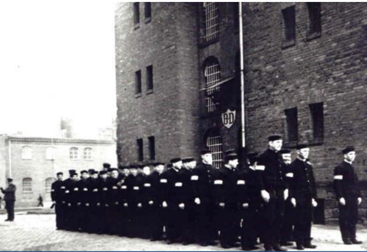
אסירים בבית הכלא בהאלה, ללא ציון שנה (י. הרמן: "...הם שמסרו את היקר מכל, יוסיפו להתקיים בעם", האלה 1984, עמוד 47)