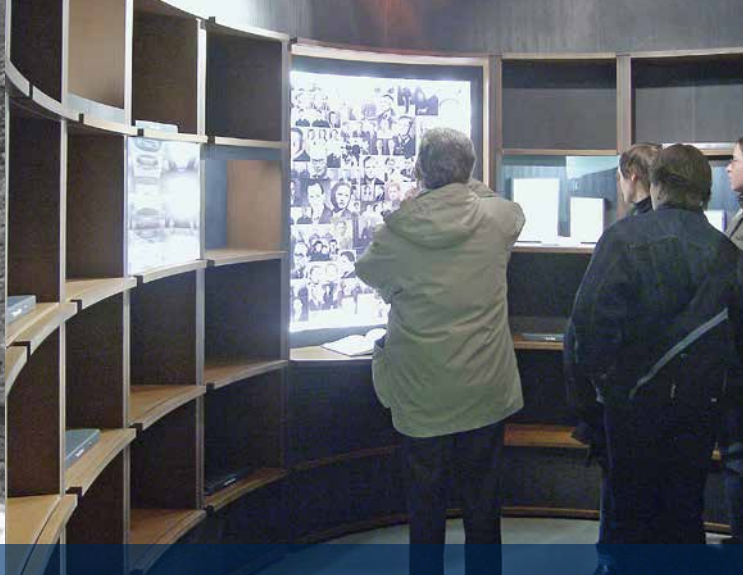
Зал „Судьбы маленьких людей“ постоянной выставки о национал-социализме, 2006

Открытый в 1996 году, Мемориал РОТЕР ОКСЕ Галле (Заале) размещен в бывшем здании для смертных казней наци-