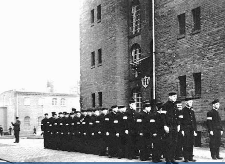
Заключенные в каторжной тюрьме Галле, год не указан (Ю. Германн, ...отдавшие самое дорогое, продолжат в народе жить, Галле 1984, с. 47)