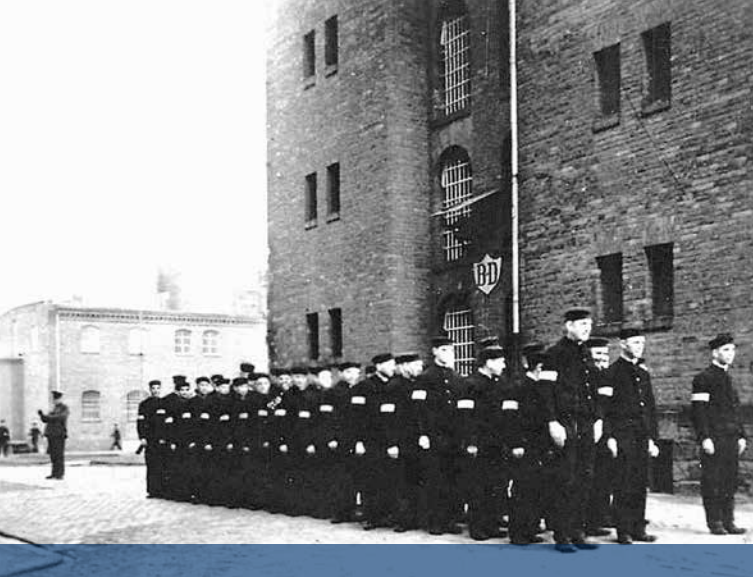
Ув'язнені у каторжній в'язниці Галле, рік не вказано (Ю. Германн, ...ті, хто віддали найцінніше, продовжать у народі жити, Галле 1984, с. 47)