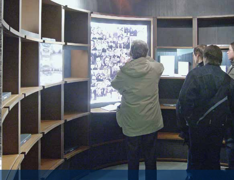
Зал «Долі маленьких людей» постійної виставки про націонал-соціалізм, 2006 (ікоп Ганновер)